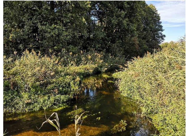
Upės pakrančių šlapynė Nemuno baseine, Lenkija

Šlapynių sausinimas sukelia durpžemių nykimą ir suslūgimą. Tai didina potvynių, sausrų bei durpynų gaisrų riziką, neigiamai veikiančių ne tik kaimo, bet ir miesto gyventojų gyvenimo kokybę. Nusausinti durpynai yra vienas iš pagrindinių šiltnamio efektą