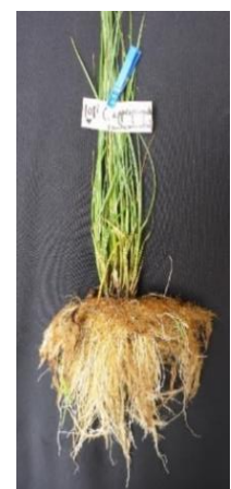
Kairėje ir centre: skirtingų rūšių viksvų ( Carex spp.) durpių kaupimo potencialo eksperimentas. Dešinėje: antžeminės ir požeminės Carex appropinquata augalo dalys.